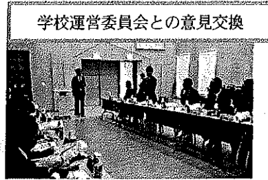
学校運営委員会との意見交換