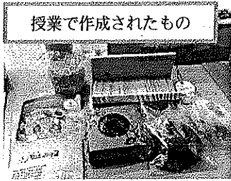
授業で作成されたもの