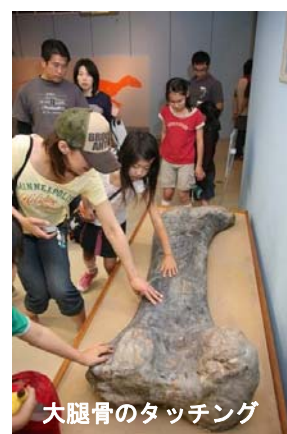
大腿骨のタッチング