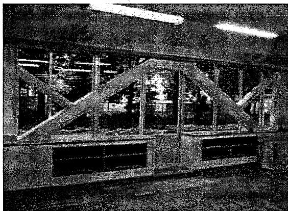
〔 内部補強(枠組み鉄骨ブレース) 〕