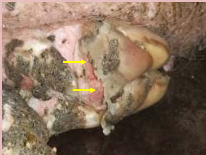
蹄部の水ぶくれの破れ