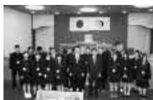
北栄町高校生議会 (1月)