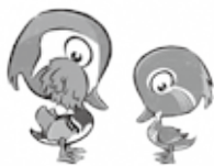
日野高校マスコットキャラクター【オッシー・ドリー】