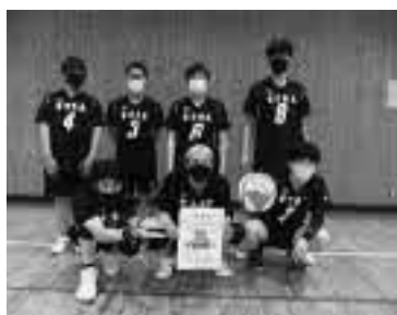
【県定通高校総体】 バレーボール

4月から9月までが前期、10月から3月までが後期の2学期制です。定められた単位を修得すれば9月卒業も可能です。