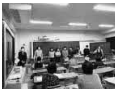
【2年次生関西研修】 （夜間中学校交流）