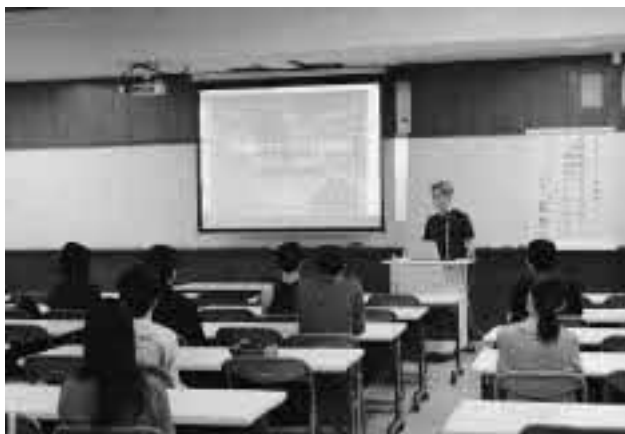
【キャリアアップ講座（進路講演会）】

鳥取大学、神戸学院大学、長崎国際大学、千葉商科大学、美作大学、鳥取看護大学、鳥取短期大学、大阪アニメーションカレッジ専門学校、神戸ファッション専門学校、鳥取県立産業人材育成センター、ヤンマーアグリジャパン、ENEOSウイング、東宝企業、マルイ、万翠楼、寺方工作所、鳥取東伯ミート、米久おいしい鶏