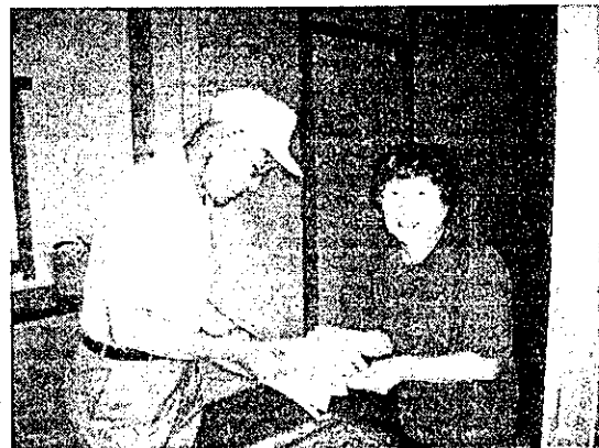
(交通安全協会支部長による訪問)