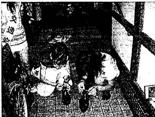
(小学生が参加しての反射材貼付活動)