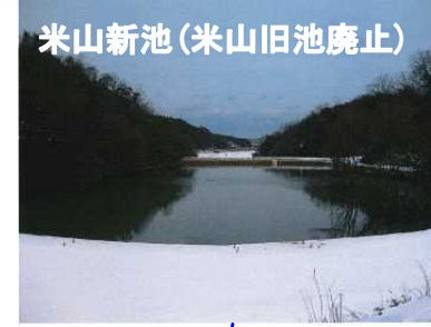
米山新池(米山旧池廃止)