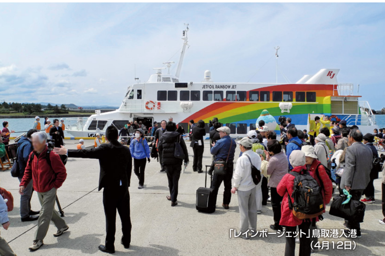
「レインボージェット」鳥取港入港 (4月12日)