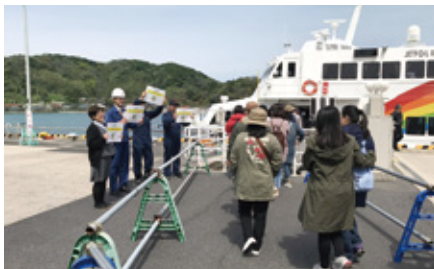
鳥取へ向かう韓国からのツアー客らをお見送り 【七類港】

チャーター便が寄港した七類港や西郷港でも、歓迎の横断幕や記念品等の配布、民謡「隠岐しげさ節」等による歓迎イベントが開催されました。また、西郷港到着後の夜には郷土芸能が披露され、乗船されたツアー客の方々は「東郷・今津神楽」や「隠岐太鼓」の演奏を楽しまれました。