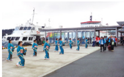
民謡「隠岐しげさ節」による歓迎 【西郷港】