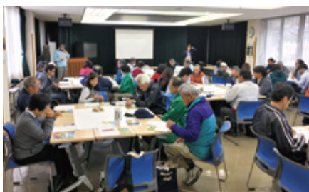
合同研修会の座学

「山陰海岸」、「隠岐」、「島根半島・宍道湖中海」のジオパーク関係者約60名(ガイド、事業者、行政関係者等)が隠岐に集まり、第1回目となる「山陰3ジオパーク合同研修会」が開催されました。座学や体験を通じた意見交換により、情報共有が図られ、3ジオパークの交流が深まりました。