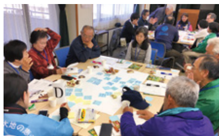
合同研修会でのワークショップ