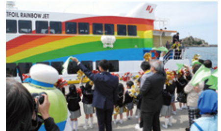
緑のハンカチを振ってお見送り