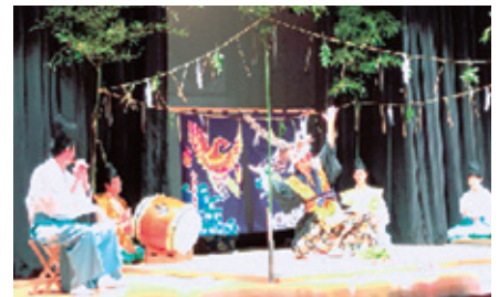
古来より伝わる「東郷・今津神楽」 【隠岐島文化会館】