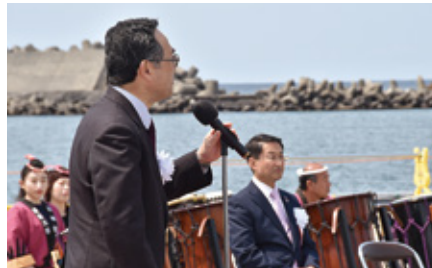
知事・市長による歓迎挨拶