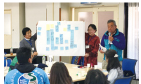
合同研修会でのグループ発表