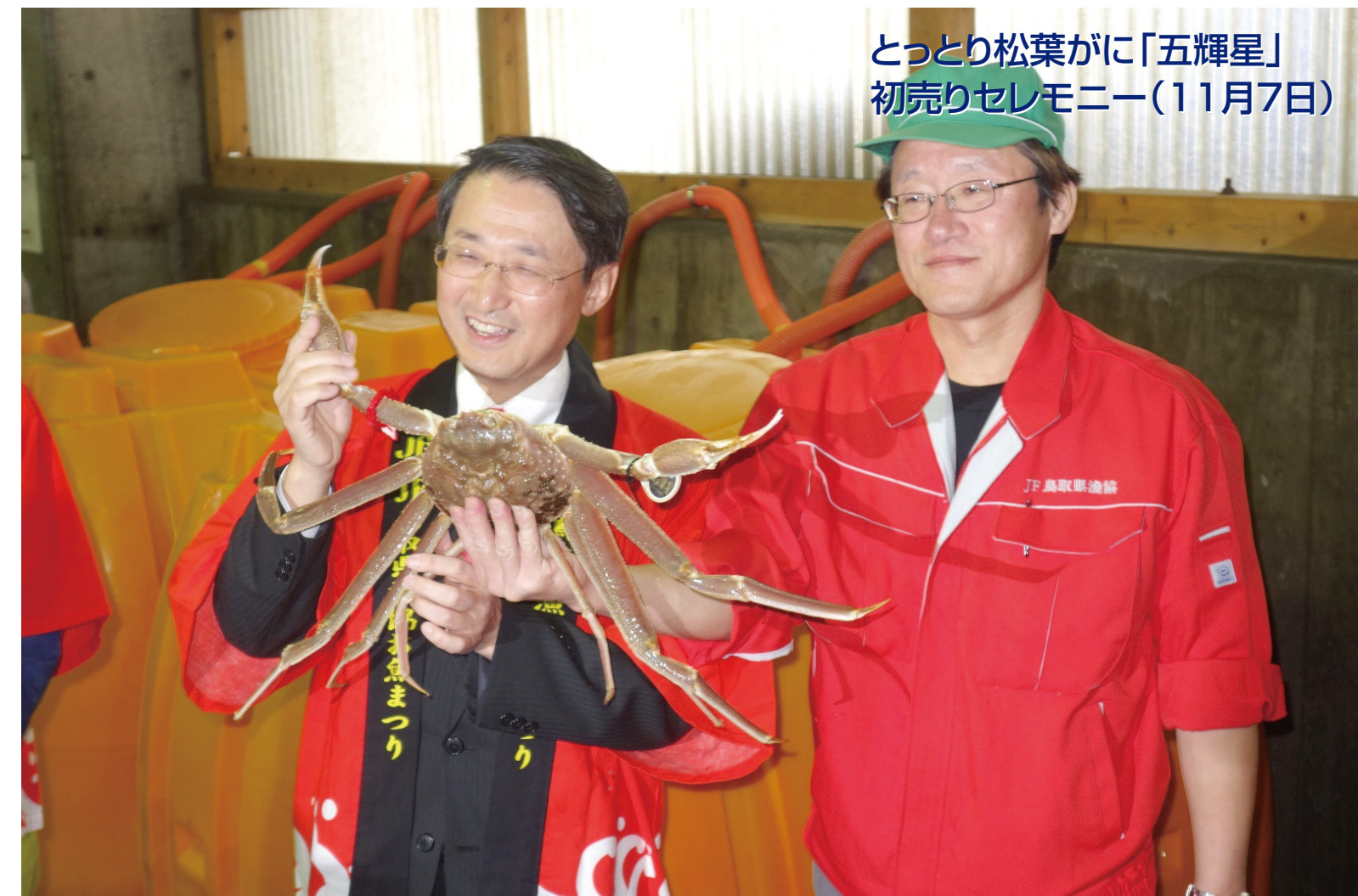
とっとり松葉がに「五輝星」 初売りセレモニー(11月7日)