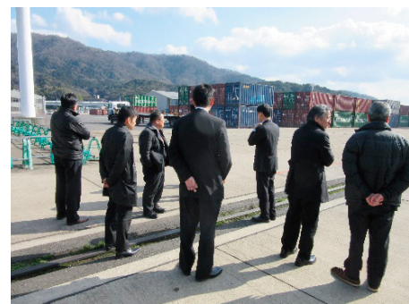
舞鶴市役所の職員による説明