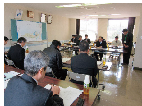
福井港湾事務所の職員による説明