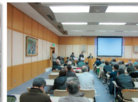
コアサンプルを手にとり説明されました