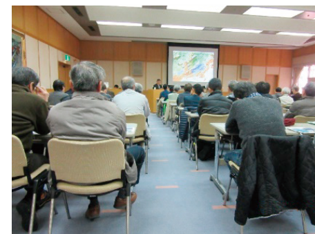
松本特任教授の講義

また、「鳥取市内には、鳥取県や鳥取大学の協力もあり、海底で採取したコアサンプルを保管する施設もでき、鳥取県は日本海側の調査拠点としての役割を果たしている。」との説明がありました。