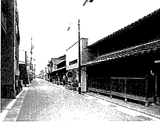
拡大地区 本町通り沿いの景観