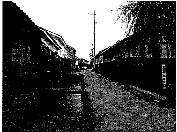
拡大地区 玉川沿いの景観