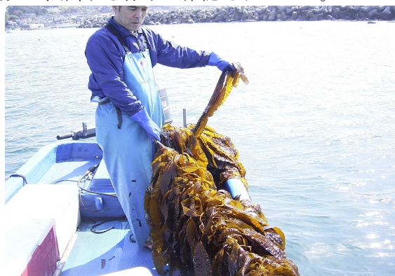
図7 養殖されたスジメ