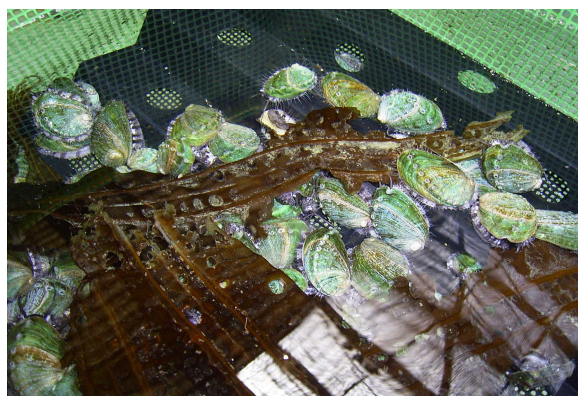
図8 スジメを活発に摂餌するアワビ