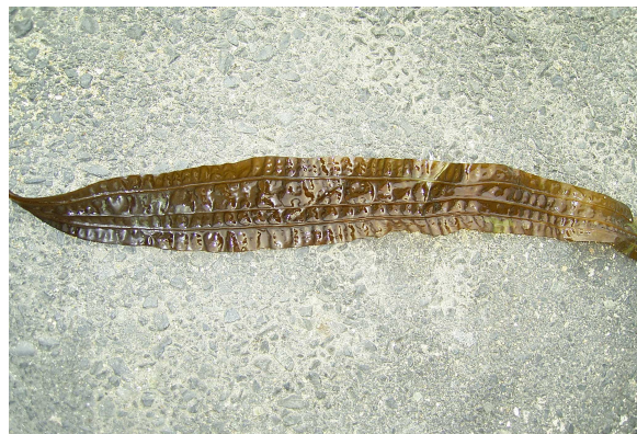
図9 5本筋が特徴のスジメ

春先にとれる若い葉の部分を利用し、天ぷら、海藻サラダ、味噌汁の具等として美味しくいただくことができます。