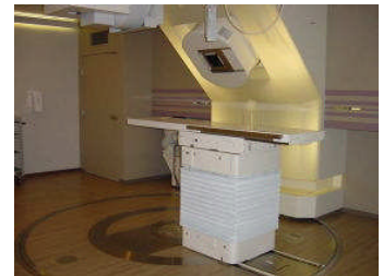
（写真）兵庫県立粒子線医療センター