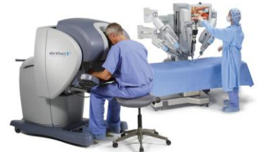
(例) 第2先進医療技術 前立腺がんに対する内視鏡手術支援ロボット