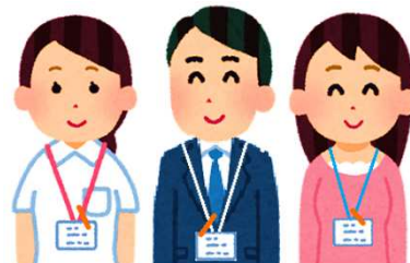
市町、相談支援事業所、保健所