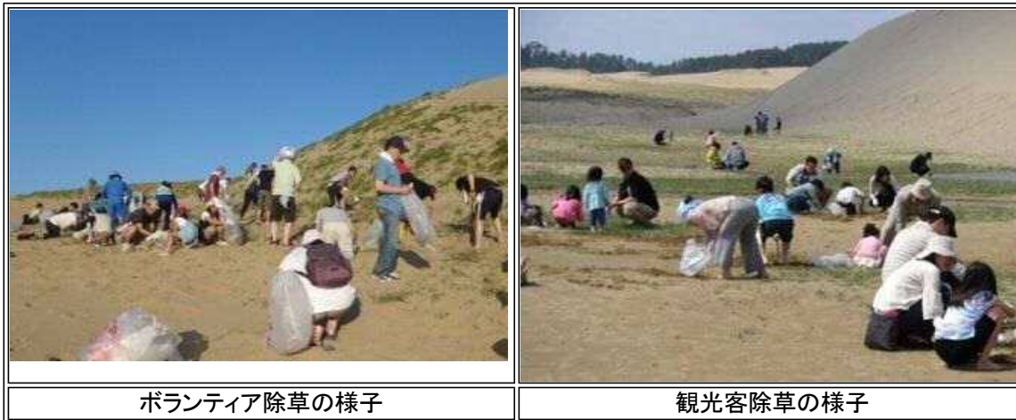
ボランティア除草の様子