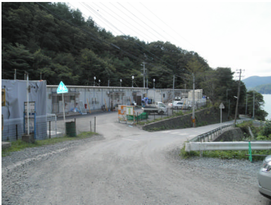
雄勝地区立浜仮設住宅 (第 3 5 班)