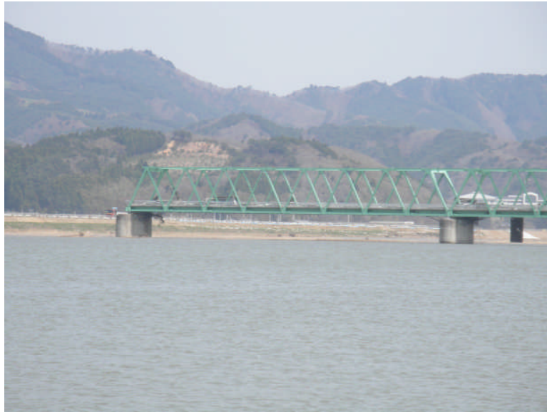
橋の一部が流された北上大橋（第 11 班）