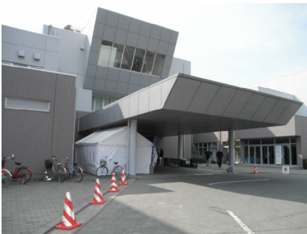
ビッグバン避難所（第4班）