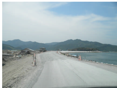
北上川の堤防が完成したので鉄板道はなくなっていました（第 22 班）