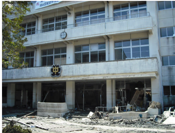
湊中学校避難所（第2班）