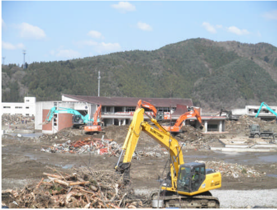
大川小学校 (第 11 班)