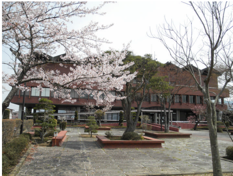
石巻市役所河北支所（第11班）