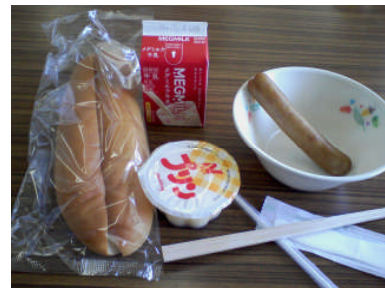
門脇中学校給食 (第 22 班)