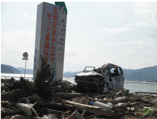
北上大橋入口高台（第 11 班）