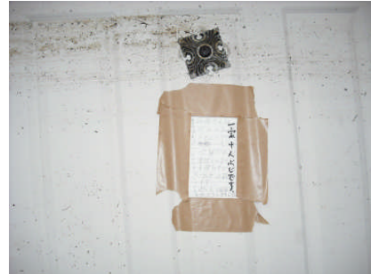
家族の安否を知らせる張り紙 石巻市内（第2班）