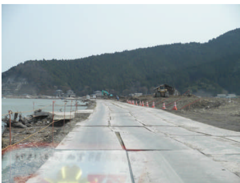
北上川の堤防が崩れたため川岸に鉄板を敷いて道路にしていました（第 11 班）