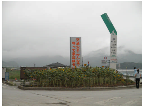
北上大橋入口高台・ ひまわりが植えられていました（第 35 班）