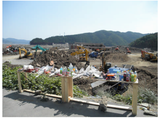
大川小学校 (第 22 班)