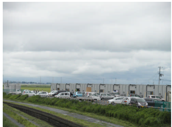
河北地区三反走仮設住宅 (第 3 5 班)