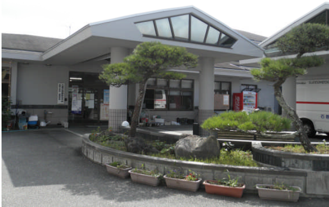
現在の石巻市役所雄勝支所・雄心苑 （第35班）