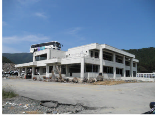
勝雄中央公民館（第22班）