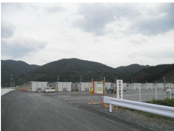
大森第 3 仮設住宅 (第 4 3 班)