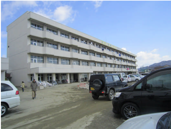
住吉中学校避難所（第1班）