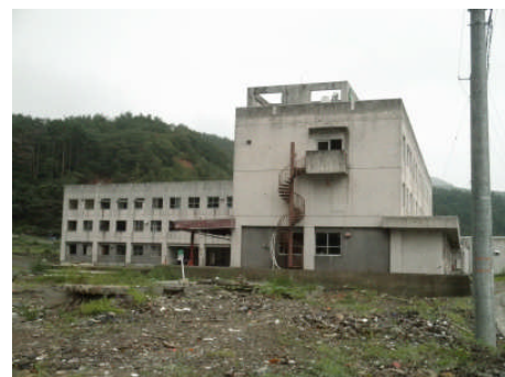
震災前の石巻市役所雄勝支所 （第35班）