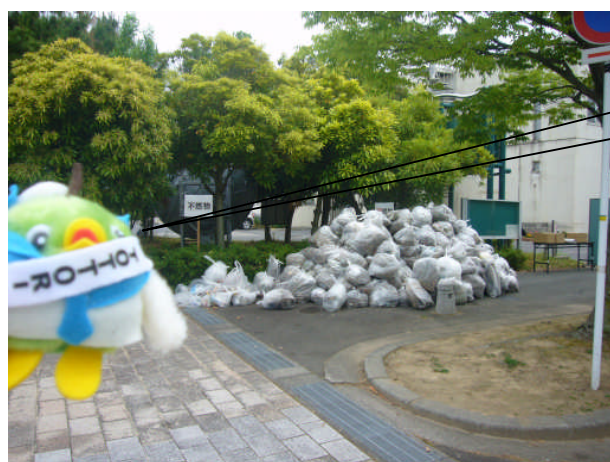
米子会場で集まったゴミ 2トンものゴミが回収されました。