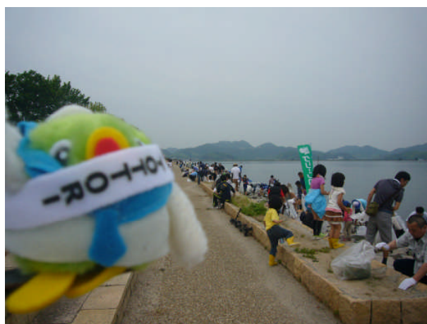
米子会場（湊山公園）の様子