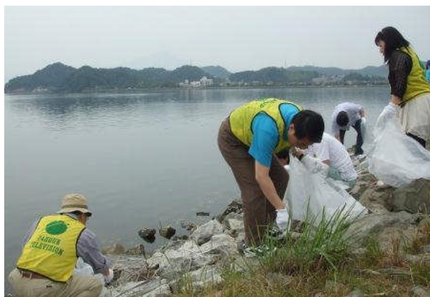
メイン会場の安来会場には、平井知事、溝口知事も参加されました。

米子会場（湊山公園）では、1,050人が参加し、2トンのゴミを回収し、また、境港会場（西工業団地）では、182人が参加し、0.74トンのゴミを回収しました。