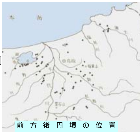
前方後円墳の位置