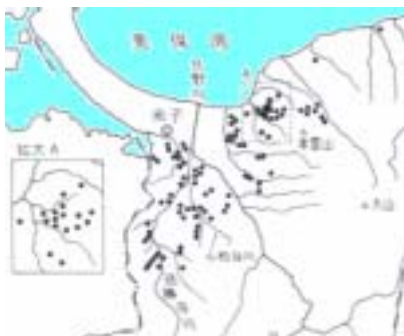
前方後円墳の位置