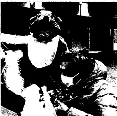
当事者の会 クリスマス会