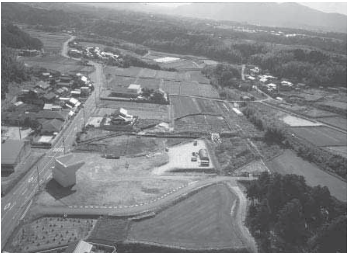
2 調査地近景 4 2004年度調査後（北から）