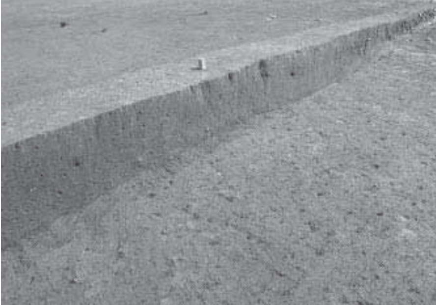
1 C区南北トレンチ D-D 土層断面 (北西から)