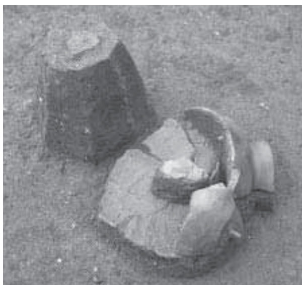
3 竪穴住居1 91出土状況(南東から)