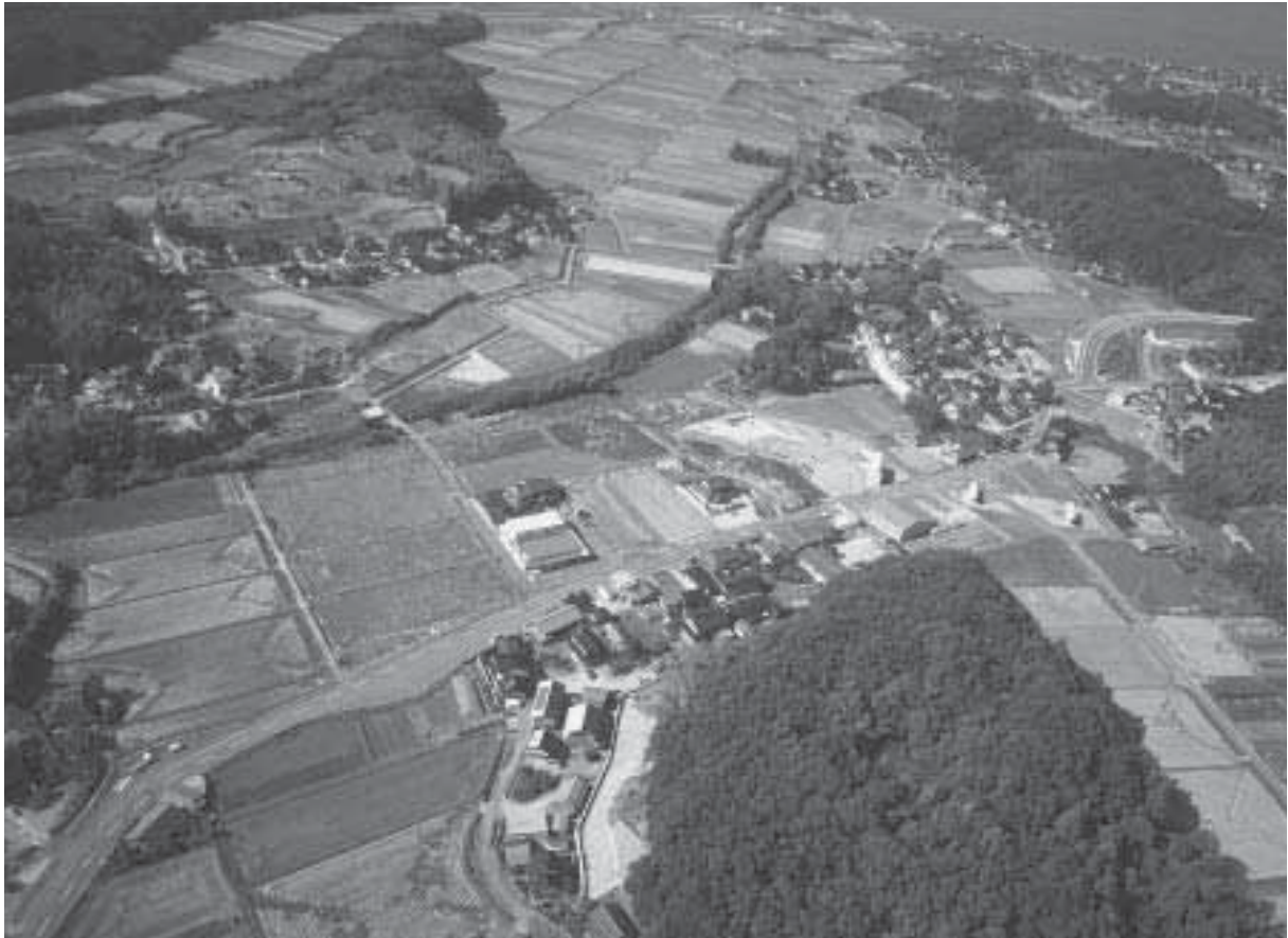
1 調査地近景 3 2004年度調査後（南東から）