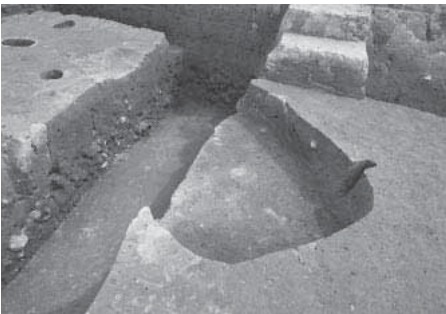
3 土坑1完掘状況 (南西から)