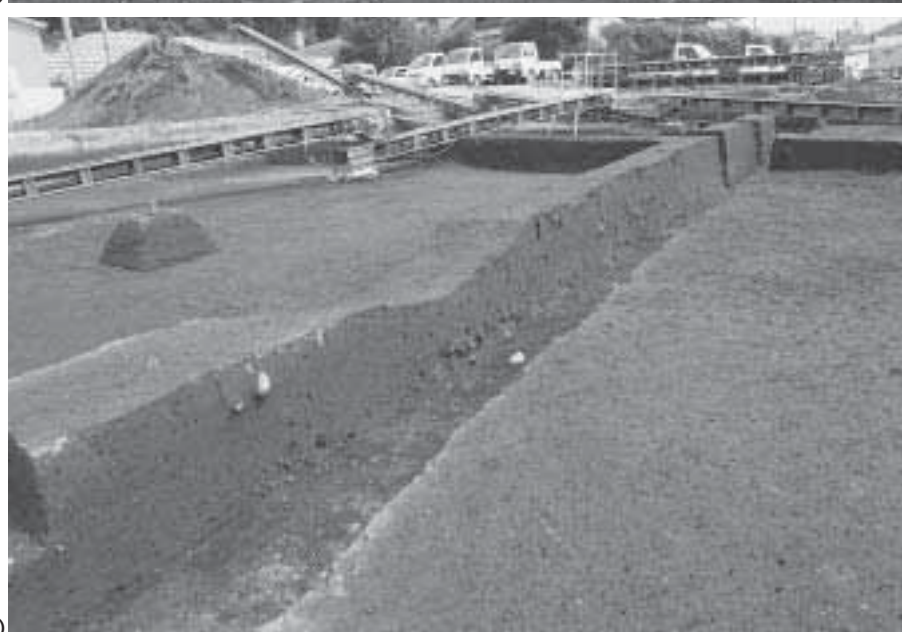
3 B区南北トレンチ D-D 土層断面 (北西から)