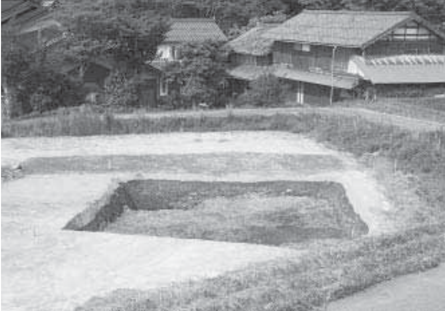
1 第1調査地完掘状況 (南から)