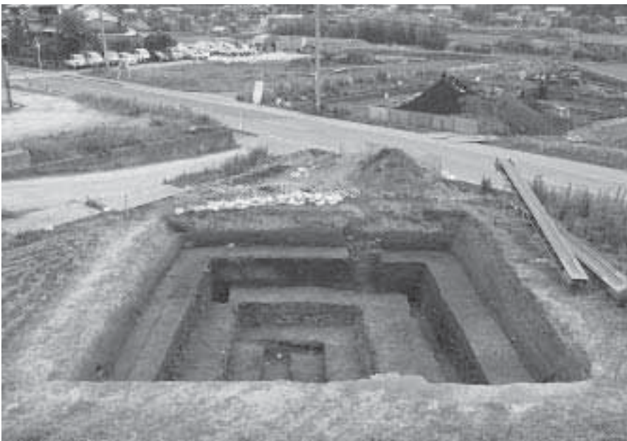
2 第2調査地完掘状況 (北東から)