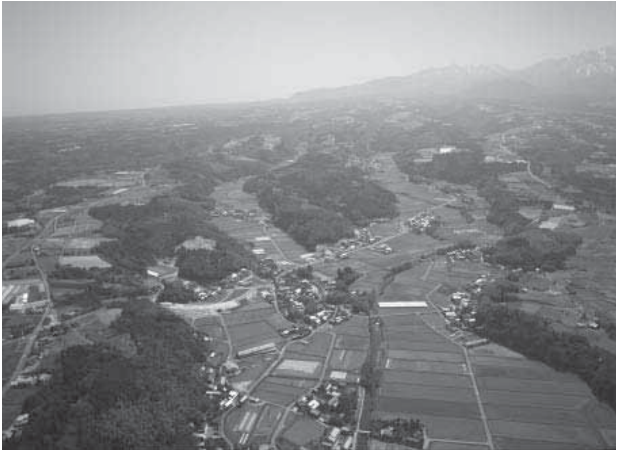
1 調査地遠景 1 調査前（北西から）