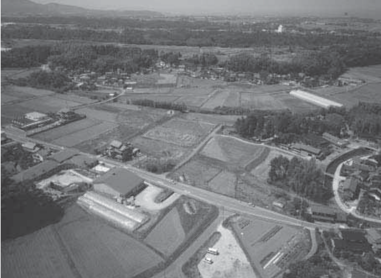
1 調査地近景 1 調査前（東から）