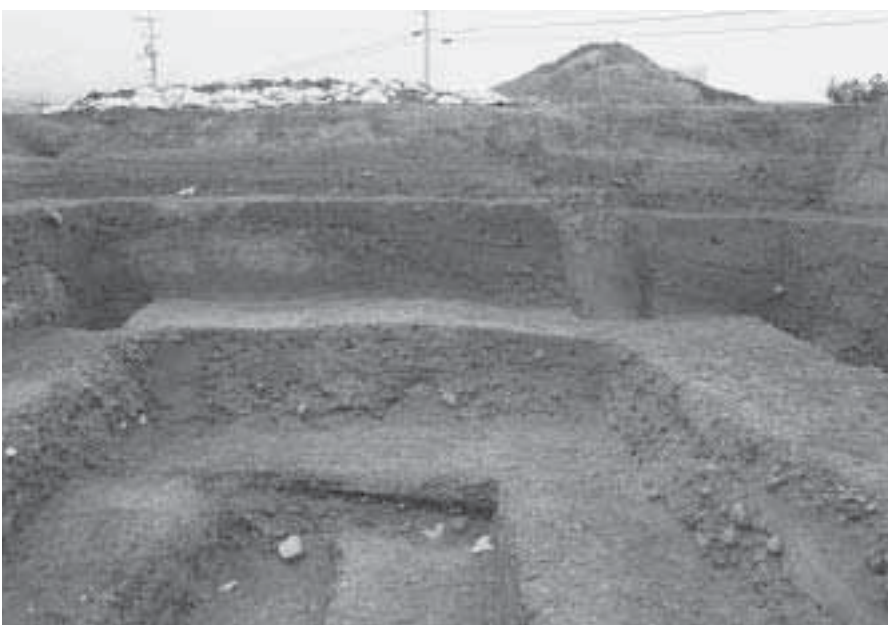
3 第2調査地 西壁土層断面 (東から)