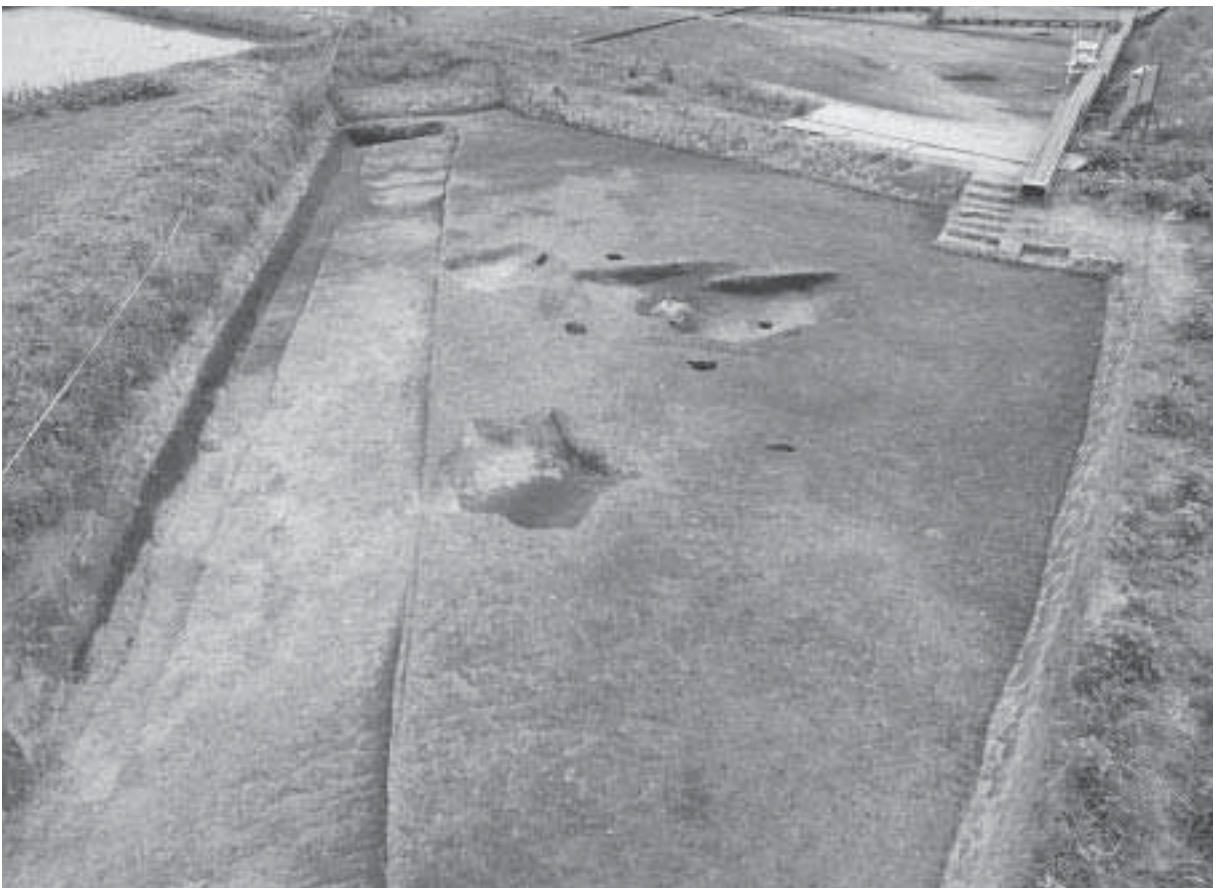
1 D区第1遺構面完掘状況(北東から)