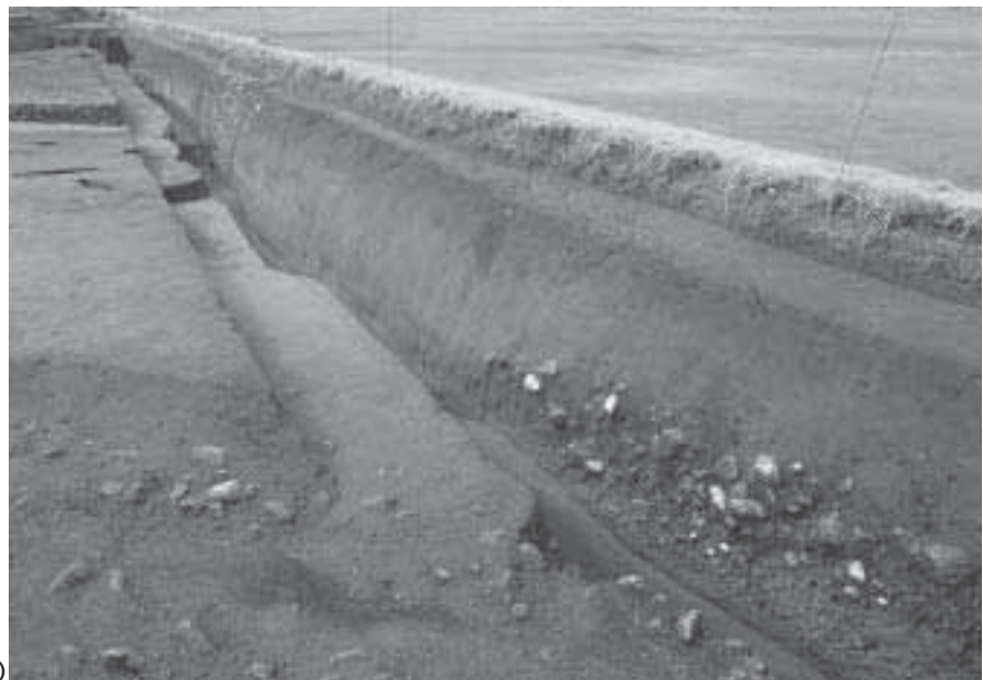
2 A区北壁西半部 A-A 土層断面 (東から)