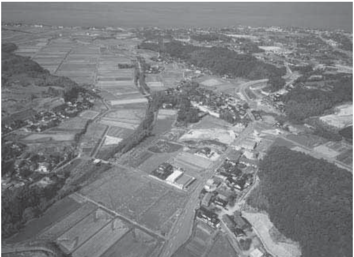
2 調査地遠景 2 2004年度調査後（南から）