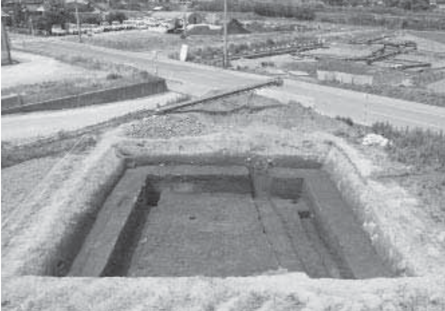
1 第2調査地 第4遺構面完掘状況 (北東から)