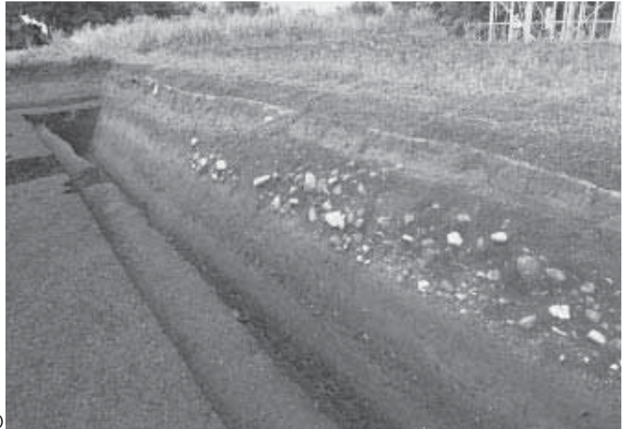
1 A区北壁東半部 A-A 土層断面 (南東から)