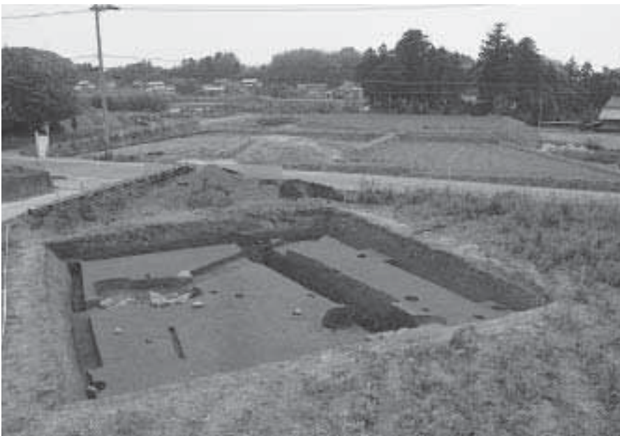
2 第2調査地第1遺構面 完掘状況 (東から)