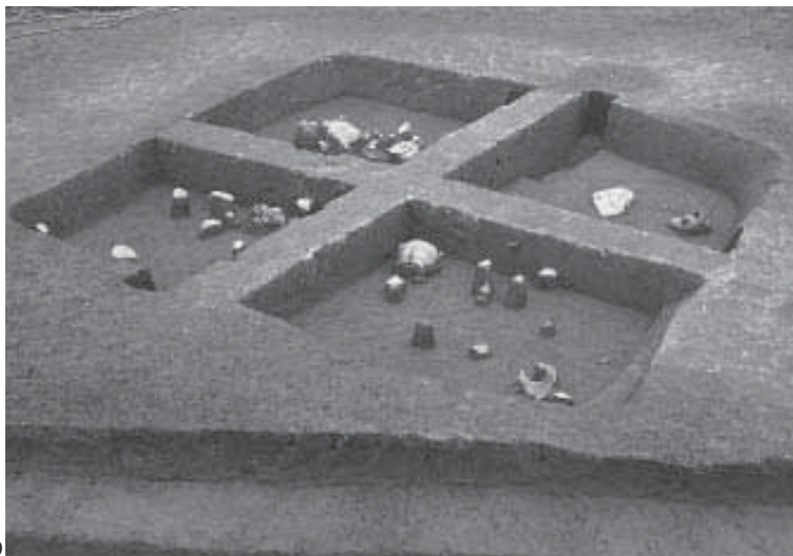
1 竪穴住居1 遺物出土状況1 (南から)