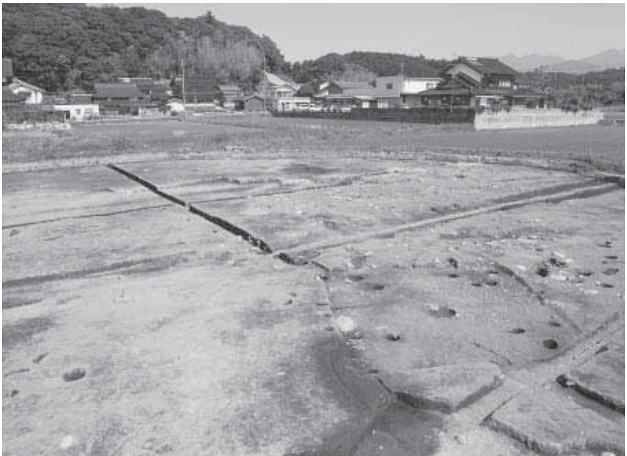
2 E区第1遺構面完掘状況(北西から)