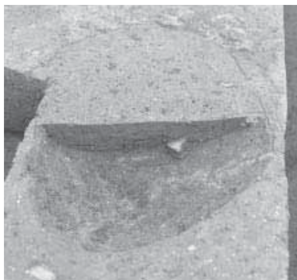
4 竪穴住居1 P5土層断面(北から)