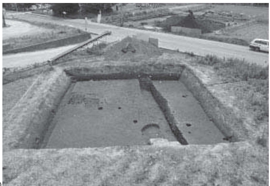
4 第2調査地 第3遺構面完掘状況 (北東から)