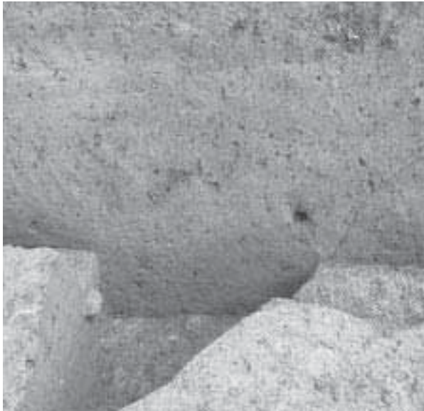
1 土坑2土層断面(南西から)