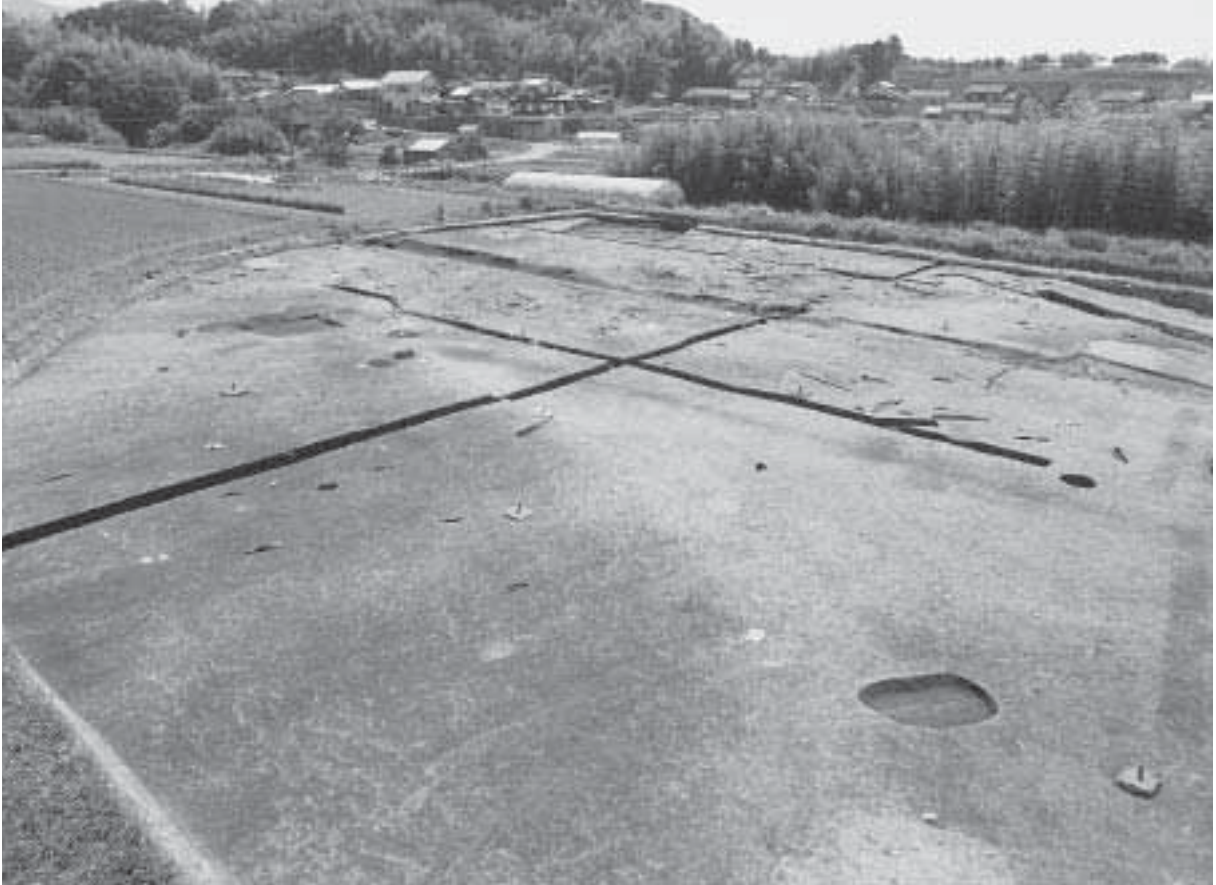
1 E区第1遺構面完掘状況(北東から)