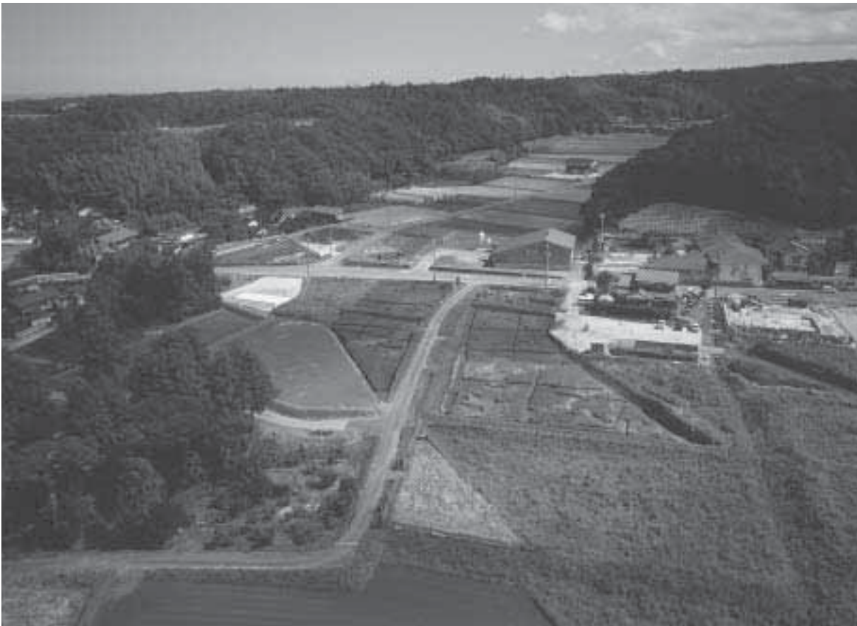
2 調査地近景 2 2003年度調査後（西から）