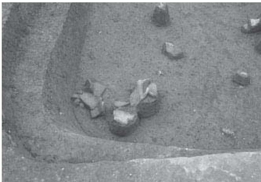
2 竪穴住居1 遺物出土状況2 (東から)