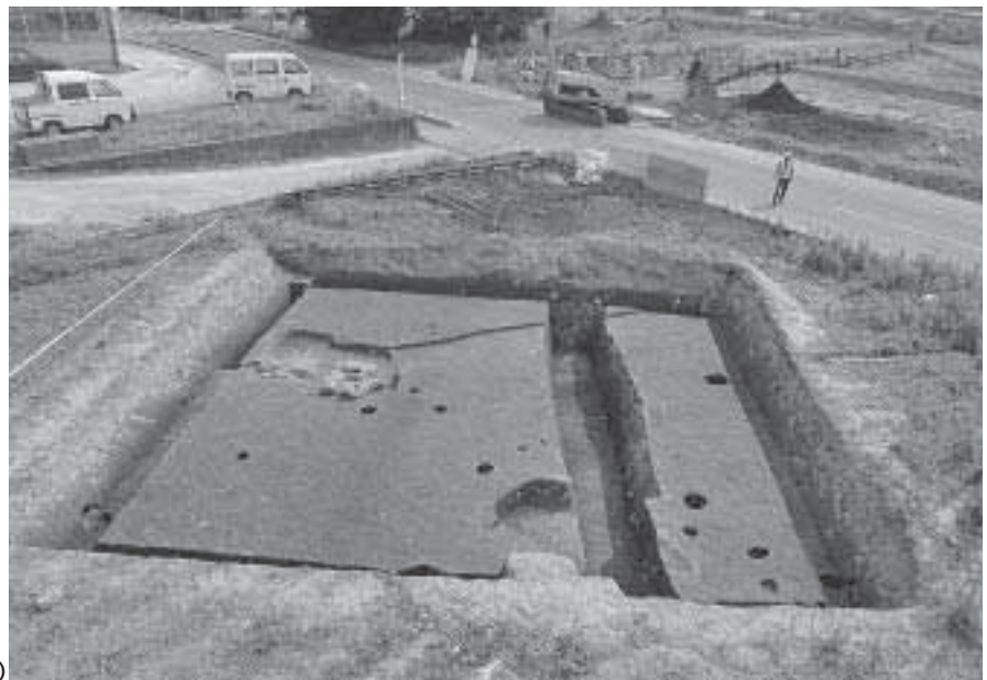
3 第2調査地 第2遺構面完掘状況 (北東から)