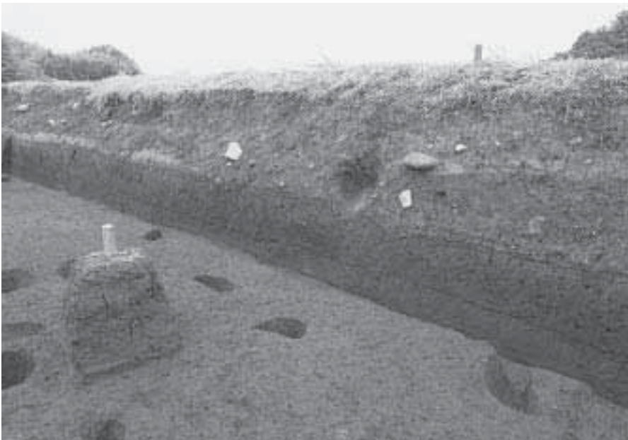
2 E区北壁 F-F 土層断面 (南東から)