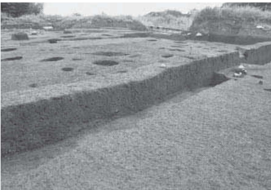
3 E区南北トレンチ G-G 土層断面 (南東から)