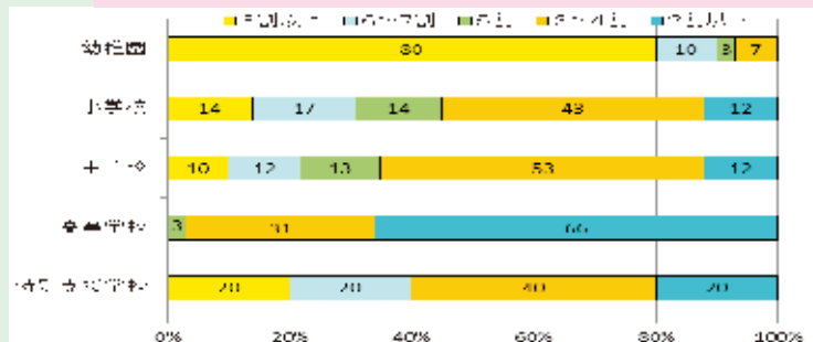
【PTA 研修会、学級学年懇談会等への保護者の参加状況】