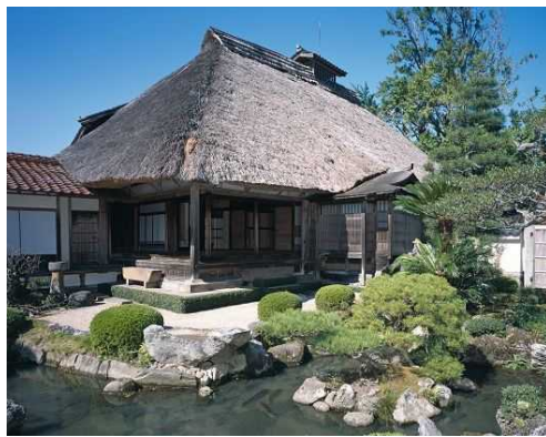
松甫園から主屋を見る