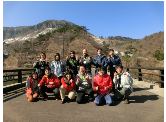
今年度の受講生（船上山にて）