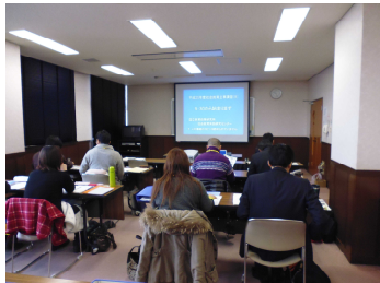
インターネットでの講義

東京を主会場に全国10会場で開催されています。1日のスケジュールは、9時30分に始まり、90分の授業を4コマ受講します。途中、昼食や休憩を挟み、17時15分に終了です。講義は東京会場からインターネット中継されます。私たち鳥取会場の受講者は、大きなスクリーンを見ながら講義を受けています。質問がある場合は、東京会場にFAXを送り、講師に答えていただきます。また、演習として船上山少年自然の家での宿泊研修や社会教育施設の見学などもあります。講習後半は、各自治体の基本計画（施策）をもとに各自で事業計画を立てます。20代から50代まで様々な立場の人が集い、情報交換をしながら毎日学んでいます。