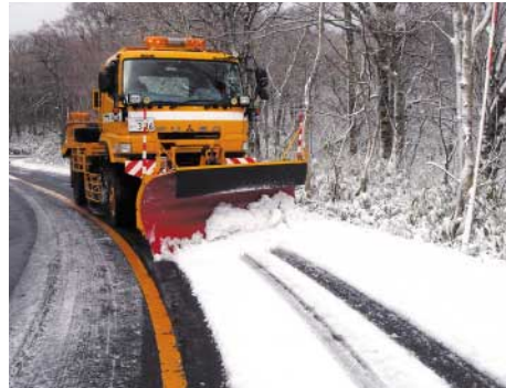
平成23年11月24日 除雪車初動出！ 倉吉江府溝口線鏡ヶ成地内 積雪10cm

これにより、住民の皆さまに身近な道路の除雪をよりスムーズに行うことを目指していきます。