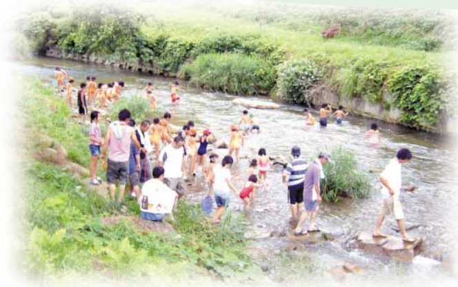
川を利用した親子の交流 (九塚川河川公園管理運営委員会)

鳥取県では、県が管理している道路、河川等の環境美化や維持管理に積極的に参加していただける住民団体を募集し、活動を支援しています。 地域の河川や道路を一番身近な住民の方が清掃、除草活動をしていただくことによって、地域の実情に応じた環境保全を図るとともに、愛護意識や美化意識の向上、地域の活性化や公共空間の利活用を促進することを目的としています。 募集内容や支援の内容は以下の表をご覧ください。