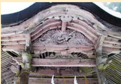
【樂樂福神社】（日南町宮内） 願いをかなえに出てきてくれ そうです。