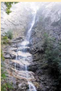
りゅうおうだき 【龍王滝】（日野町） 立派なパワースポット。 水音やその流れに癒されます。