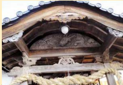
【福成神社】（日南町神戸上） ちょっと奥から地域を見守る・・・ そんな感じでしょうか。