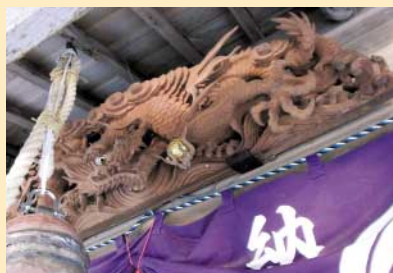
【金持神社】（日野町金持） 見上げるとそこには・・・とにか く金運アップを祈願！