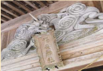
【福榮神社】（日南町神福） 実はもう一体いらっしゃいます。