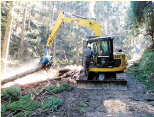
平成23年10月の講座「高性能林業機械実習」では、ハーベスタなどの機械の操作を学びました。

林業振興課では、アンケート結果を分析し、より参加意欲の高まるような内容を企画し、平成24年度も実践講座を開催していく予定です。