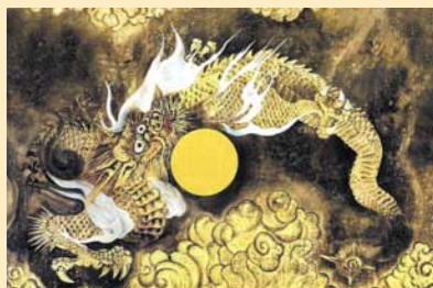
げだつじ 【解脱寺】（日南町） 天井には神々しい龍神様のお姿が。