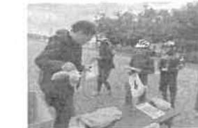
○ぼかぼかマルシェ