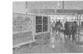
○ぼかぼかマルシェ