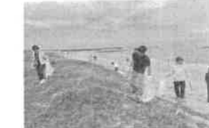
○わんわんウォーキング