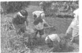
○生息生物実態調査