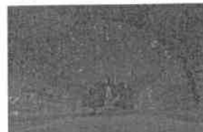
○ウィンターイルミネーション