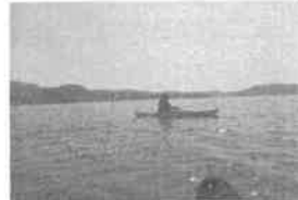
○セキショウモ移植作業