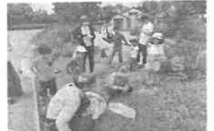
○おもしろ工作教室