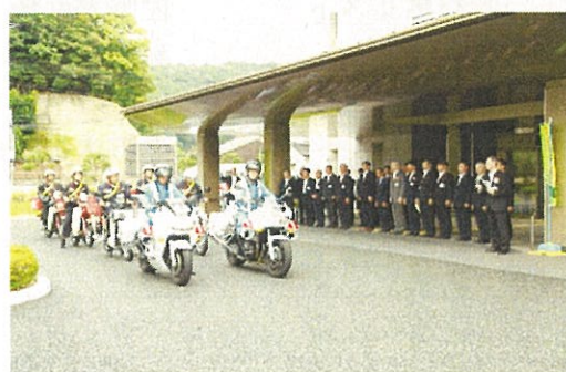
【広報出発式の様子】