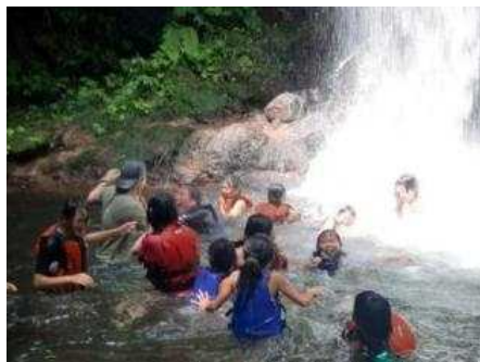
船上山の夏を楽しむ体験