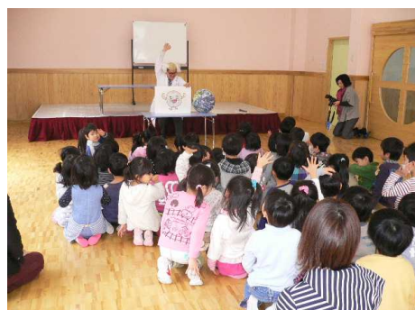
園児向け環境学習研修会（エコ劇場）