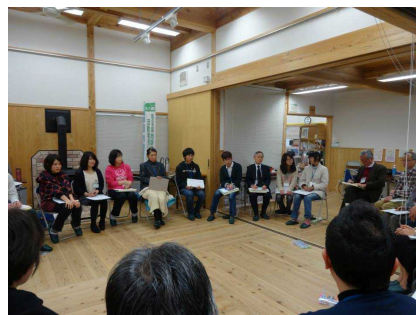
地球温暖化防止活動推進員養成講座