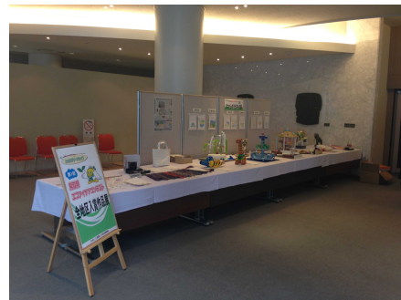
エコアイデアコンテスト入賞作品展示