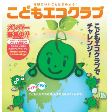
こどもエコクラブパンフレット

自然観察会やエコツーリズム等の自然体験やものづくりやサービス提供等の現場等の環境教育が実施される土地や建物を、体験の機会の場として県が認定する制度もあります。