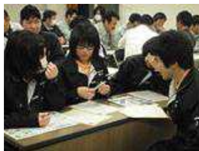
とっとり環境教育・学習アドバイザーによる環境教育学習会