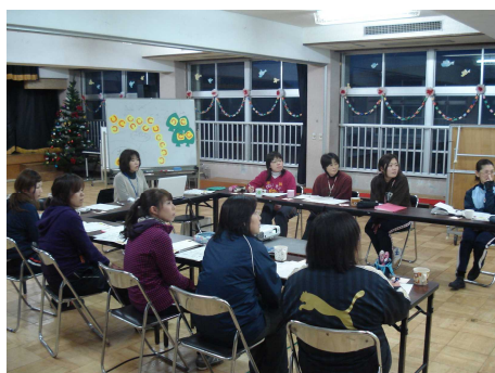
職員・保護者向け環境学習研修会

幼児期から環境を大切にする気持ちを育み、環境に配慮した行動のできる人を育成するため、幼稚園・保育所に『ちびエコアドバイザー』を派遣して、職員・保護者向け環境学習研修会や園児向け環境学習研修会（エコ劇場）を実施します。