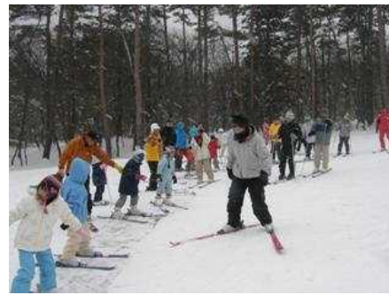
大山親子エンジョイスキー