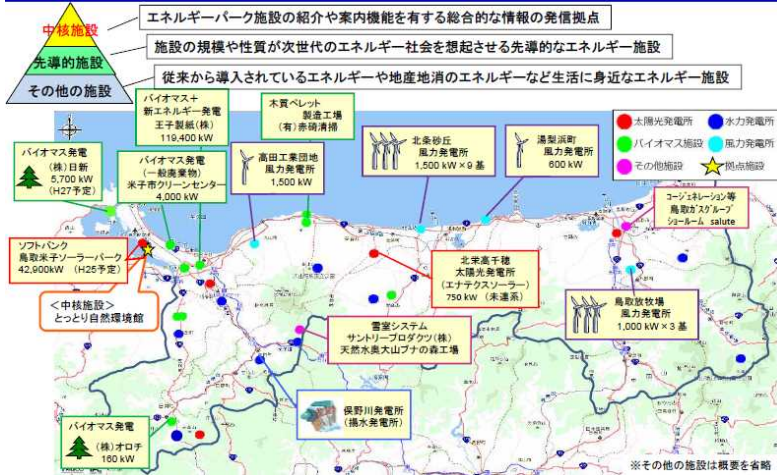
とっとり次世代エネルギーパーク施設