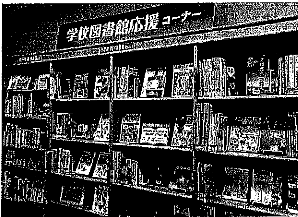
子ども読書応援ルームオープン

「児童図書研究室」を「子ども読書応援ルーム」としてリニューアルし、学校図書館関係者、保護者、子どもの読書活動推進に関わるボランティア、市町村図書館職員等に役立つ資料や情報を積極的に提供する。