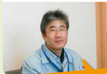
育児休業をとられた 企画部課長さん

会社と社員の皆様のご協力により、1年間の育休を取得しました。父親として初めて育児に積極的に関わることができ、妻の大変さがよくわかりました。本当に、家事、育児ともに、お互いの協力が大切ですね。