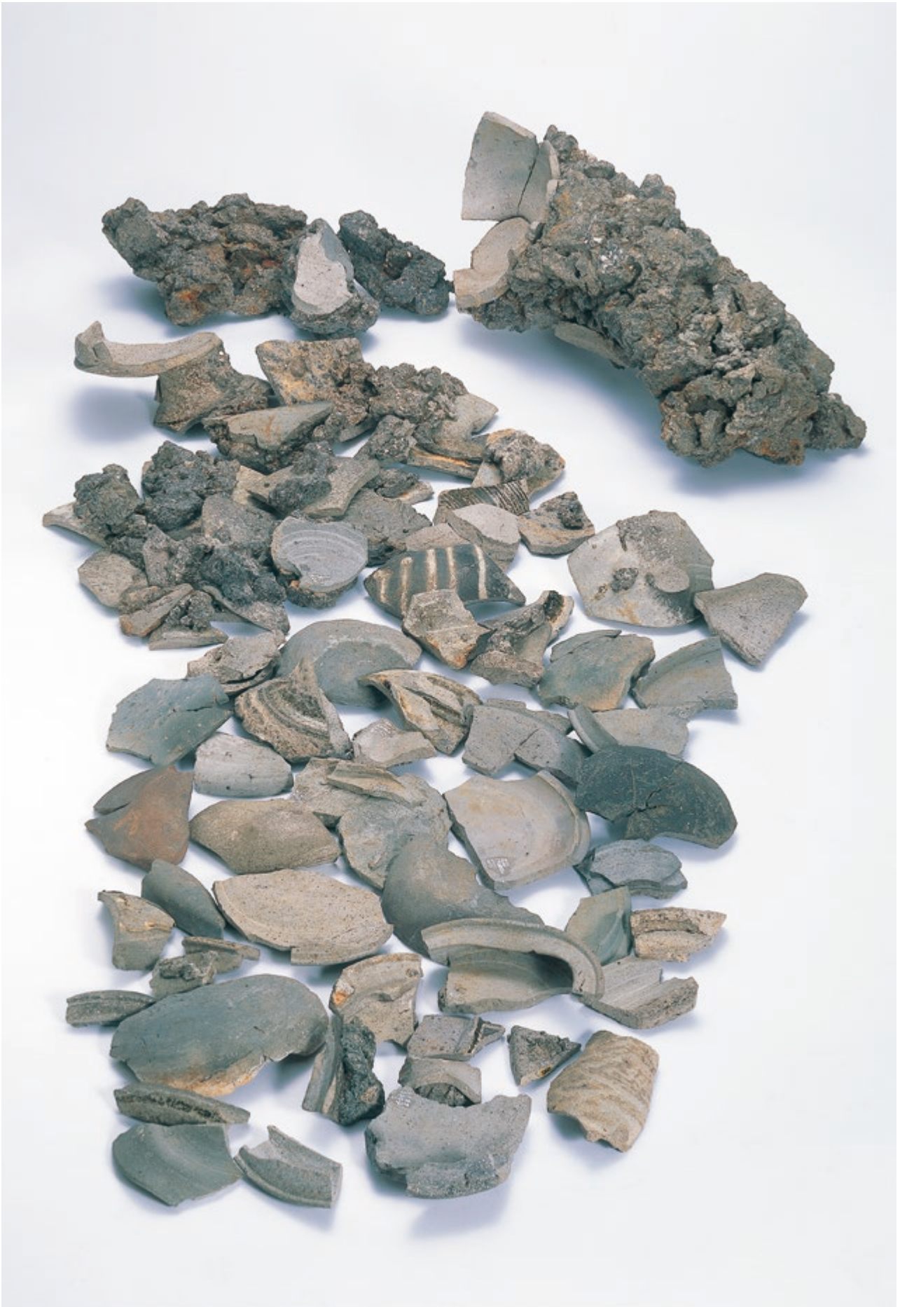
須恵器窯関連遺物