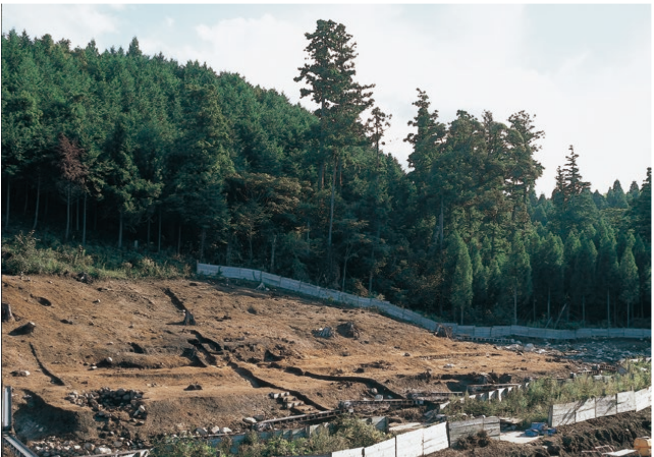
2 SS1・2完掘状況(北西から)