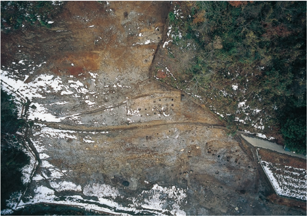
1 C区完掘状況(東上空から)