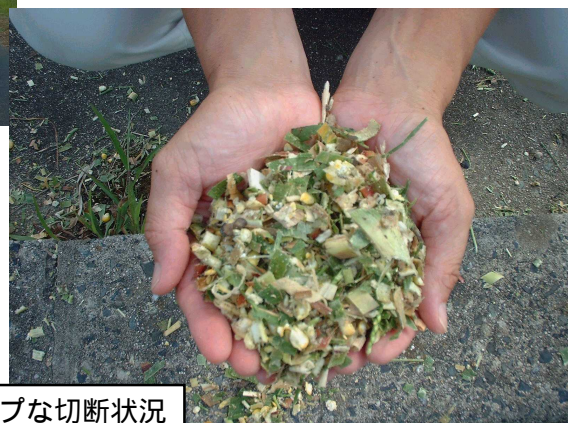
シャープな切断状況