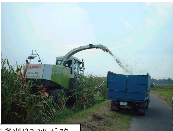
6条刈りコーンハーベスター