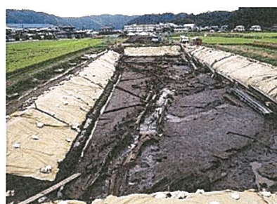
第1次調査（平成11年度）で検出された溝 ※今年度調査区は写真左側に位置

現地には駐車場がありません。青谷上寺地遺跡展示館を御利用ください。（現地まで徒歩15分）