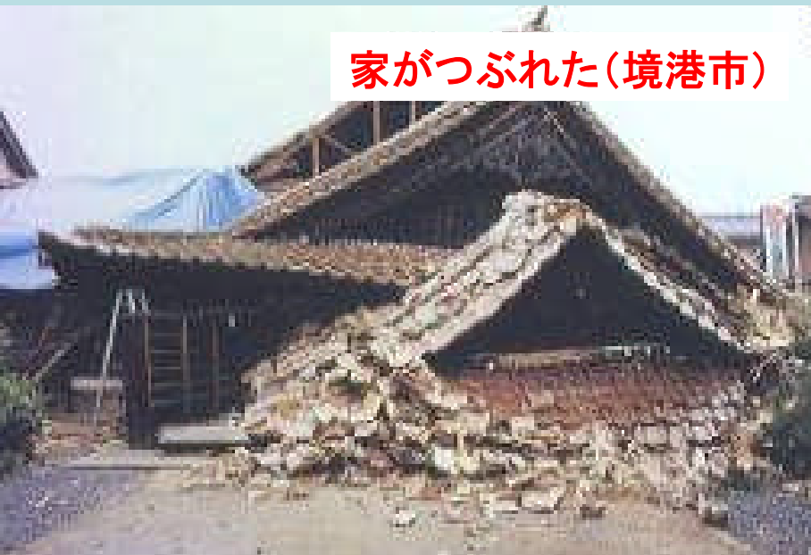
家がつぶれた(境港市)