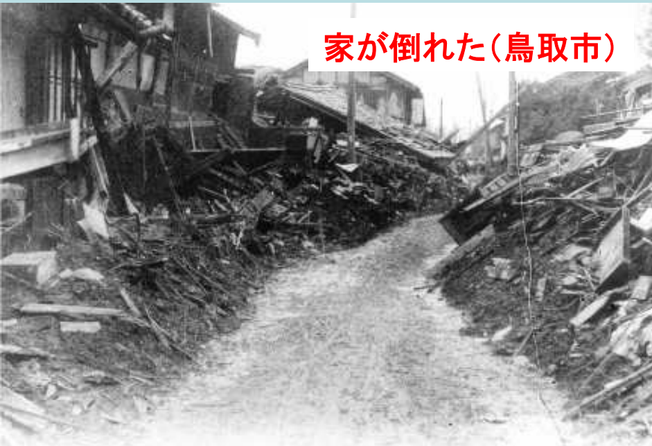
家が倒れた(鳥取市)