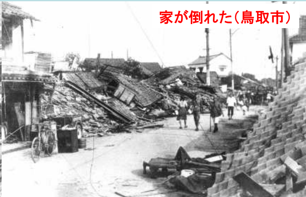
家が倒れた(鳥取市)