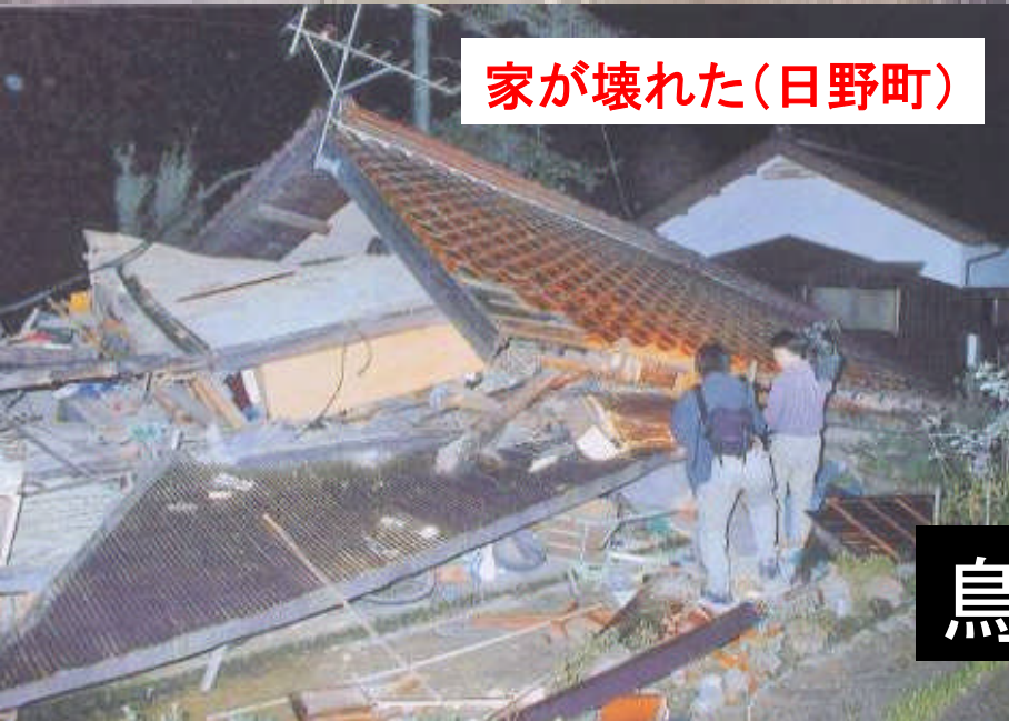
家が壊れた(日野町)