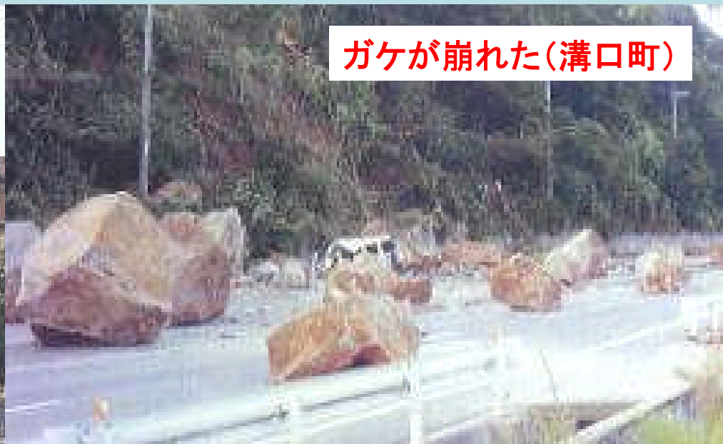
ガケが崩れた(溝口町)