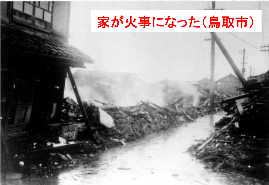
家が火事になった(鳥取市)