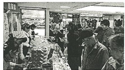
鳥取県ブースの様子