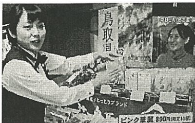
鳥取県ブースからテレビ生中継