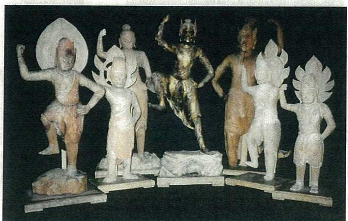
木造蔵王権現立像