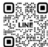
とっとりUDマップ 公式LINE

（ホームページ https://tottori-udmap.elg-front.jp/udmap/ ）