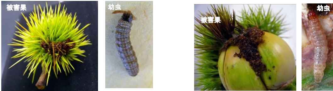
クリシギゾウムシ