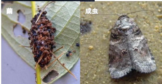
ネスジキノカワガ