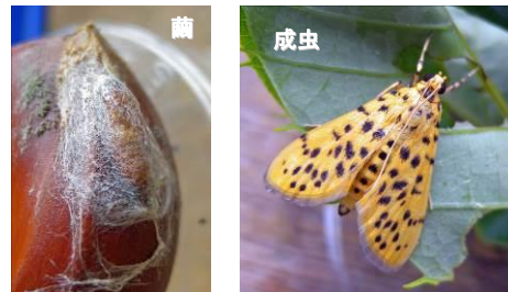
モモノゴマダラノメイガ