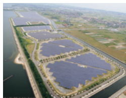
県内最大のメガソーラー