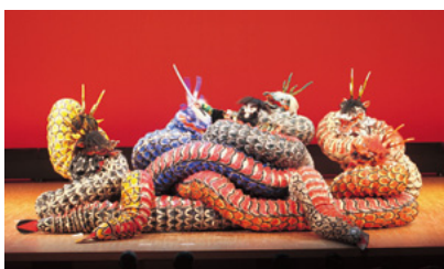
伝統芸能まつり(神楽)