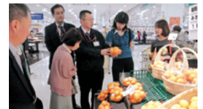
消費者によるモニター活動