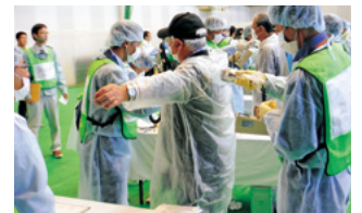
原子力災害に備えた訓練