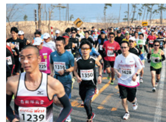
鳥取砂丘から市街地全域を駆け抜ける 鳥取マラソン大会