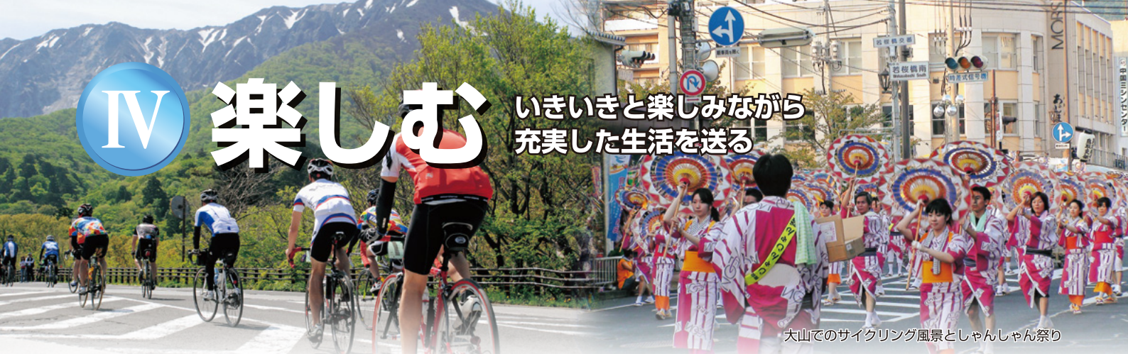
大山でのサイクリング風景としゃんしゃん祭り