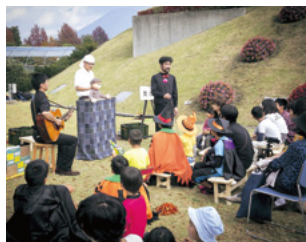
鳥取藝住祭(人形劇)