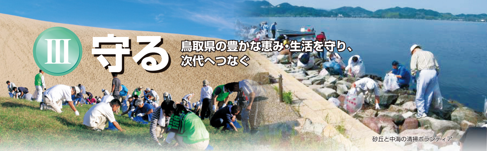
砂丘と中海の清掃ボランティア