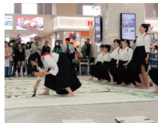
高校生による書道パフォーマンス