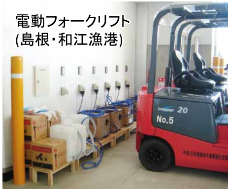
電動フォークリフト (島根・和江漁港)