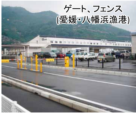
ゲート、フェンス (愛媛・八幡浜漁港)