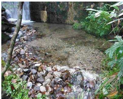
図3 丹戸沢堰堤下に造成した人工産卵場