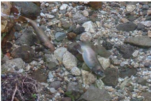
図5 丹戸沢人工産卵場でのイワナの産卵行動

1卵室あたりの産着卵数と発眼率について、人工産卵場と自然の産卵場の間で比較したところ、産着卵数は両産卵場の間で有意差はなかったが(マン・ホイットニーのU検定: p=0.243 )、発眼率は人工産卵場の方が有意に高かった( p=0.01 )。