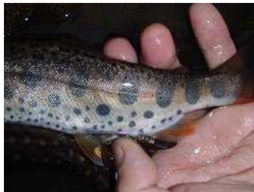
図4 アマゴとヤマメの交雑個体と考えられる個体 (左：天神川水系矢送川，右：日野川水系久那谷川)

今回の調査により、イワナについては、千代川、天神川両水系において在来個体群の生息域が推定された。これらの水域については、輪番禁漁や永年禁漁の導入、漁獲制限の強化などを検討するよう漁協へ提案していく必要がある。