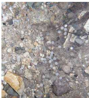
図6人工産卵場で発掘されたイワナ発眼卵