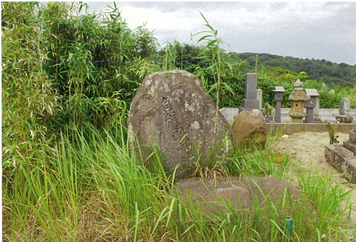
渡辺長七墓碑（中央） 平成21年9月撮影 青谷町地内の専念寺の裏手にある。 （安藤 44頁）