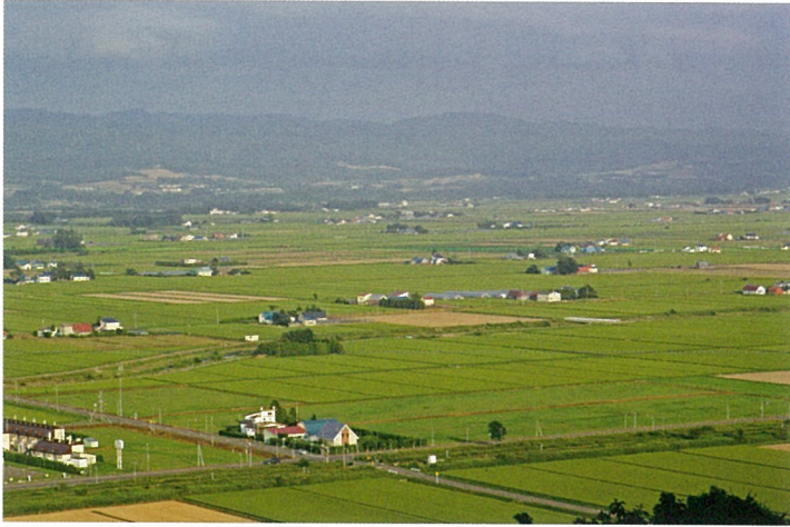
現地伏見台より望むかつての山柵農場一帯 平成21年9月撮影