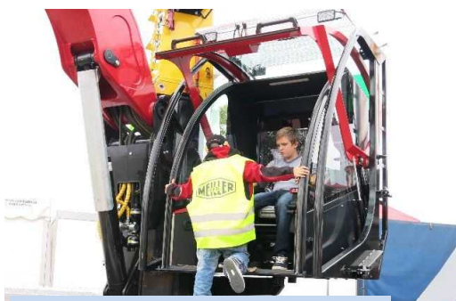
▲林業は子供達の憧れの職業