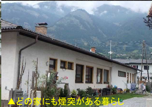
▲どの家にも煙突がある暮らし