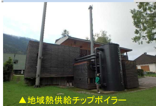
▲地域熱供給チップボイラー