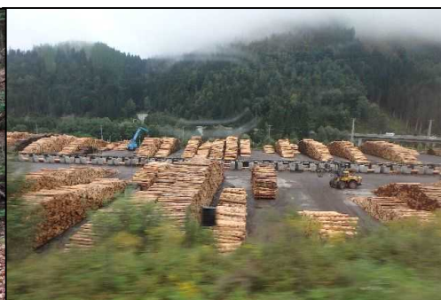
▲巨大製材所の原木選別機