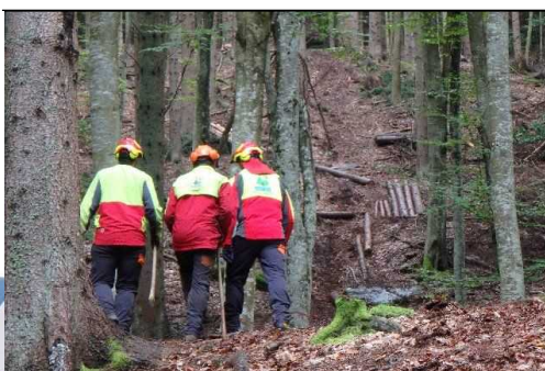
▲視認性に優れ機能的な作業服