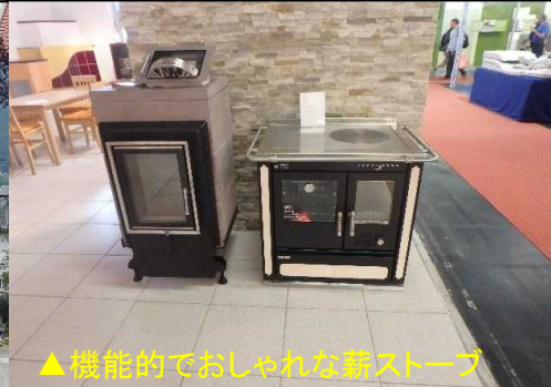
▲機能的でおしゃれな薪ストーブ

再生可能な資源“木材”を利用し、林業・木材産業・バイオマス利用の発展により、豊かな地域づくりを進めているオーストリアの取組を学び、森と木を活かした地方創生へ向けた大会宣言をします。