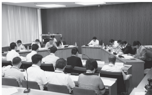
総務教育常任委員会での審議

学校の数の維持と学級定員の引下げ」を求める陳情は、研究留保として引き続き議論することに決定した。