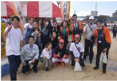
住吉フレンド保護者の皆様・関西八頭応援隊・八頭町の販売スタッフ一同