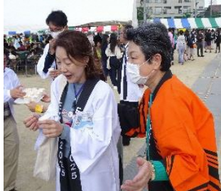
西条柿を試食される平澤大阪市住吉区長